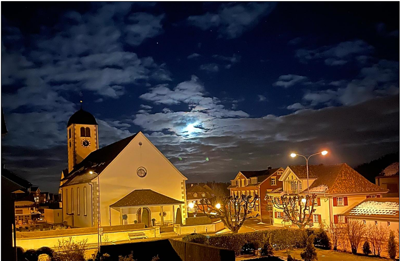
Herrlich wie das Zentrum von Häggenschwil bei Nacht strahlt.